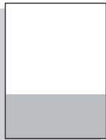
1/3 quer 210 x 99 mm