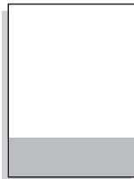
1/4 quer 210 x 74 mm

Alle Anzeigenformate liegen im Anschnitt (Breite x Höhe) + jeweils 3 mm Beschnitt an den außenliegenden Kanten! Textabstand zum Rand: mind. 8 mm! Anzeigen im Satzspiegel und Sonderformate nach Vereinbarung.