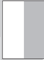
1/2 hoch 105 x 297 mm