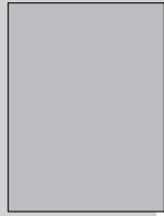
1/1 Seite 210 x 297 mm